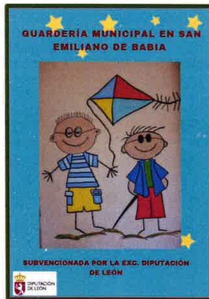
Imágenes: Cartel de apertura de la guardería municipal.