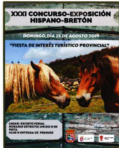
Imágenes: Concurso de Hispano-Bretón