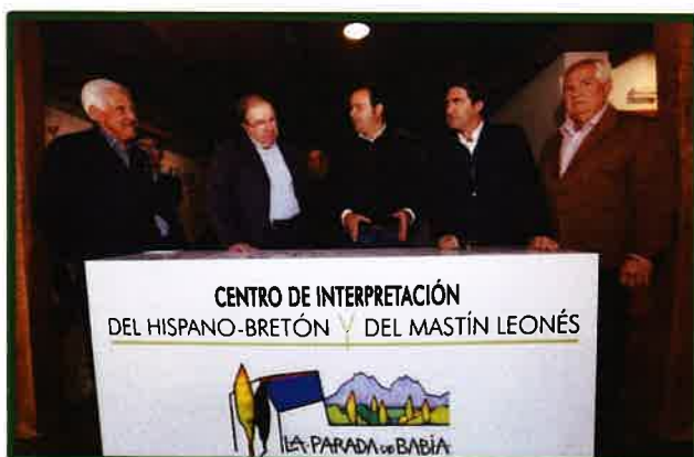
Imagen: Inauguración del Centro de la Parada de Babia